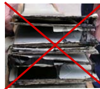
bei uns KEIN Verkleben