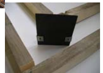
auch für Holwände